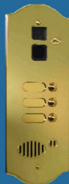
Satinato colore ottone