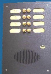
Lucido colore canna di fucile