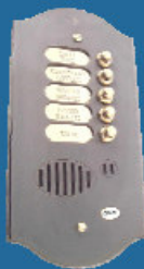
Satinato colore canna di fucile