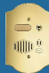
Lucido colore ottone

Trattamento PVD anche su pulsanti e targhette