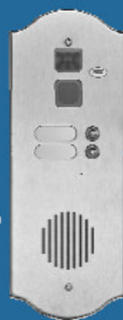
Satinato colore acciaio

La tecnologia PVD (Physical Vapor Deposition) permette di rivestire oggetti con un trattamento elettrolitico al Titanio e conferisce una protezione senza pari contro gli agenti atmosferici